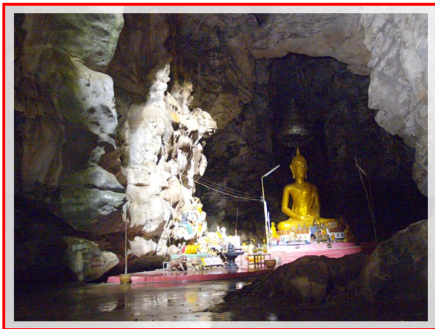
ถ้ำบ่อยา

ตั้งอยู่บนเขาในเขตตัวเมืองนครสวรรค์ ภายในบริเวณวัดประกอบด้วย พระอุโบสถ สมเด็จพระพุทธโคดม จำลอง