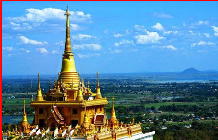
วัดศรีวงศ์

ตั้งอยู่บนเขาในเขตตัวเมืองนครสวรรค์ ภายในบริเวณวัดประกอบด้วย พระอุโบสถ สมเด็จพระพุทธโคดม จำลอง