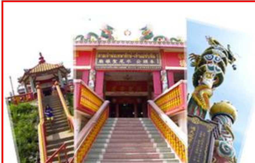
ศาลเจ้าพ่อเทพารักษ์-เจ้าแม่ทับทิม

ตั้งอยู่บริเวณชุมชนชาวปากน้ำโพ ริมฝั่งตะวันออกของแม่น้ำเจ้าพระยา ศาลแห่งนี้เป็นที่เคารพสักการะ