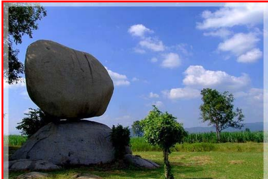
ทุ่งหินเทิน

ตั้งอยู่ที่หมู่ ๕ ตำบลปางสวรรค์ อำเภอแม่वंก อยู่ห่างจากตัวจังหวัดประมาณ ๗๐ กิโลเมตร