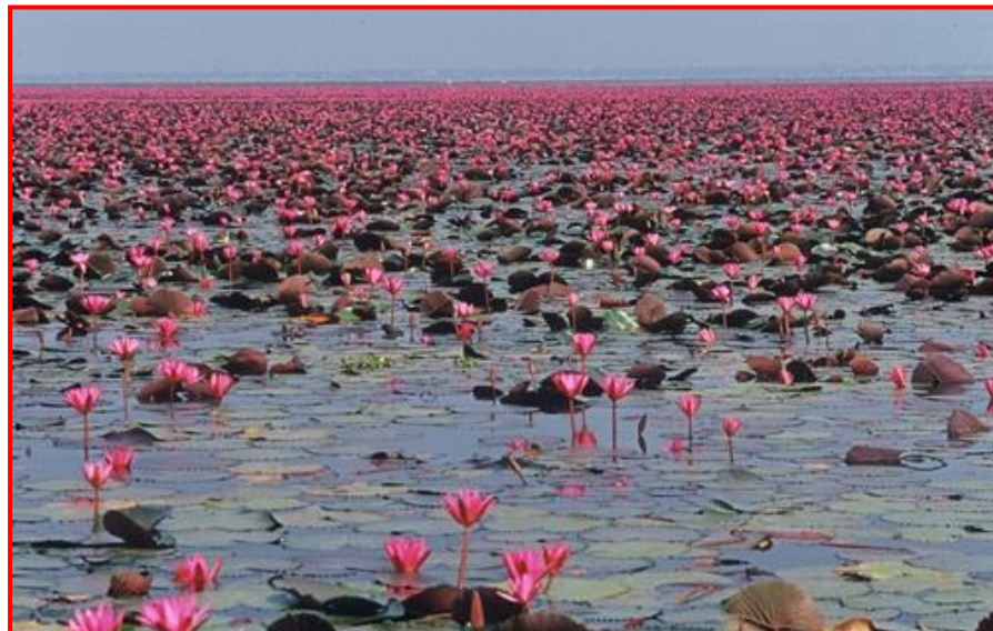
บึงบอระเพ็ด

อยู่ริมทางหลวงสายพหลโยธิน ช่วงนครสวรรค์ - กำแพงเพชร ในท้องที่ตำบลบ้านแดน อำเภอบรรพตพิสัย