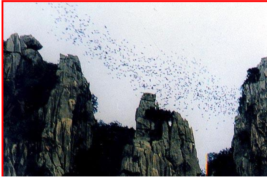
เขาหน่อ-เขาแก้ว

อยู่ริมทางหลวงสายพหลโยธิน ช่วงนครสวรรค์ - กำแพงเพชร ในท้องที่ตำบลบ้านแดน อำเภอบรรพตพิสัย