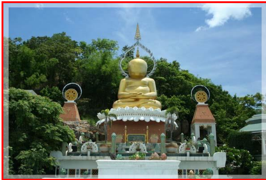
วัดป่าสิริวัฒนวิสุทธิ์

อาคารมีลักษณะเป็นรูปเรือกระแซง หรือเรือเอี่ยมจุ่น ซึ่งเป็นเรือบรรทุกสินค้าในแม่น้ำเจ้าพระยาในอดีต