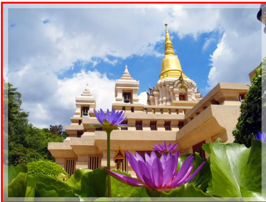
เมืองโบราณจันเสนและพิพิธภัณฑ์จันเสน

ตั้งอยู่ที่หมู่ ๕ ตำบลปางสวรรค์ อำเภอแม่वंก อยู่ห่างจากตัวจังหวัดประมาณ ๗๐ กิโลเมตร